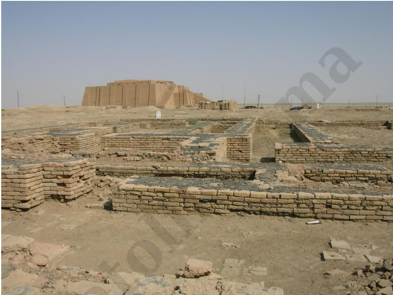
Úr romvárosa, háttérben a zikkurat (Wikipédia)